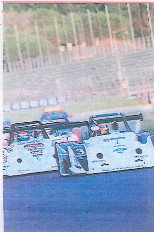
IN PISTA La gara dei Prototipi